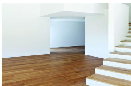
Ipari kész parketta