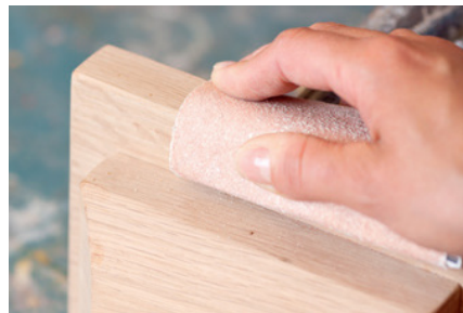
Fa és bútorigar