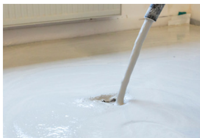
Esztrich padló | Méretezés