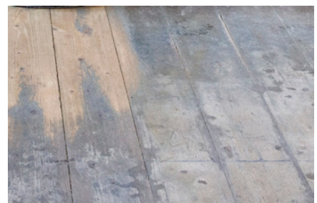
Padlólemezek | Régi padlófesték bevonatok eltávolítása